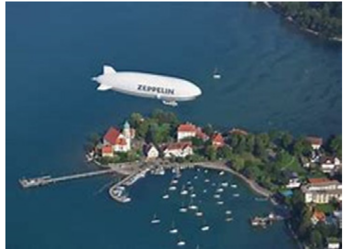
Heute freuen sich die Menschen über Zeppeline über dem Bodensee, im ersten Weltkrieg trugen die Luftschiffe Bomben.

Friedrichshafen hat eine unglaubliche Entwicklung als früher Standort von Hightech, von Ingenieurskunst und von modernsten Produkten bis in die heutige Zeit durchlebt. „Der Graf von Zeppelin wird heute oft als liebevoll lächelnder Großvater-Typ dargestellt. [...] Aber – und nochmals aber! Wir sollten endlich Schluss machen mit der romantischen Verklärung des Grafen und zumindest die dunkle Realität in seinem Leben nicht ausblenden: Zeppelin war kein Ingenieur, kein wirklicher Erfinder, nicht der romantische Alte mit dem Schnurrbart – er war durch und durch ein Militarist und