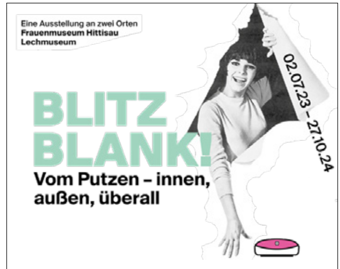
Aktuelle Ausstellung im FMH

Im Laufe der vielen Jahre bekam das FMH zahlreiche Auszeichnungen, zuletzt 2021 den europäischen Museumspreis (EMYA-Award) der jedes Jahr vom European Museum Forum verliehen wird und die höchste Auszeichnung für ein Museum in Europa darstellt. Es gibt in Europa tausende Mu-