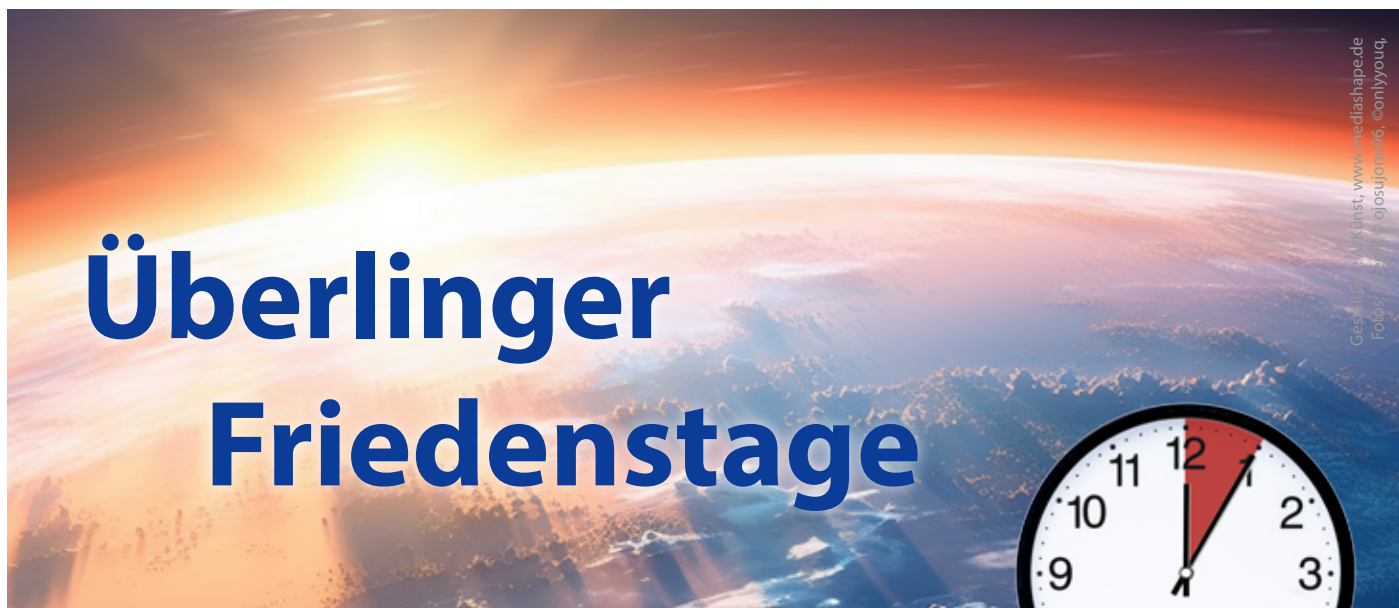
Gesamtdesign: AI-Kunst, www.mediashape.de