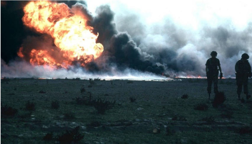
Brennende Ölfelder im Irakkrieg 1